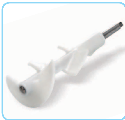
Agitatore in Pom

Agitatore a spirale e monoblocco; per mantenere ogni tipo di yogurt e produrre un gelato cremoso e consistente.