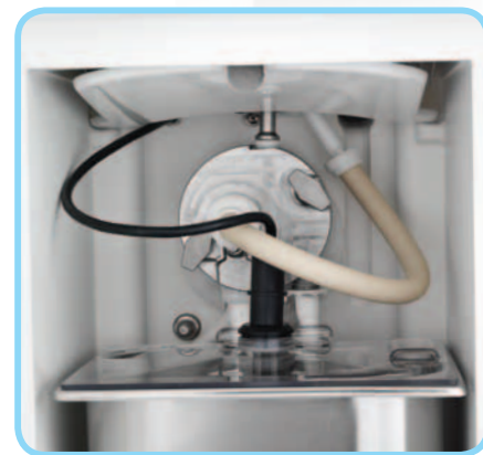
Pompa ad Ingranaggi

Agitatore a spirale e monoblocco; per mantenere ogni tipo di yogurt e produrre un gelato cremoso e consistente.